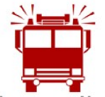
Carte : SCR-8.3 Réseau de distribution d'eau et poteaux d'incendie Secteur Magog