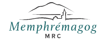
Schéma de Couverture de Risques en sécurité incendie