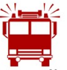
Carte : SCR-8.4 Réseau de distribution d'eau et poteaux d'incendie Secteur North Hatley