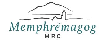
Schéma de Couverture de Risques en sécurité incendie